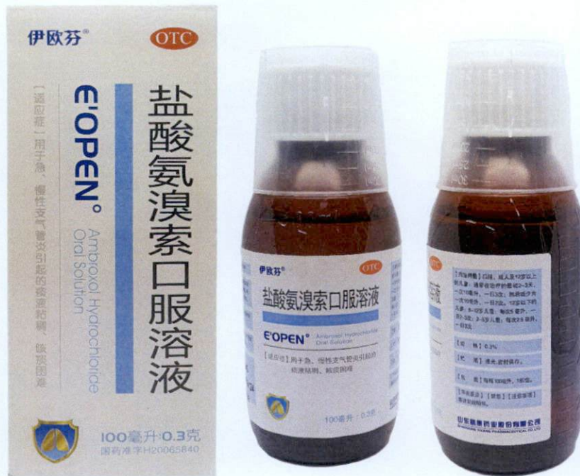
OTC E' OPEN° Ambroxol Hydrochloride Oral Solution by: Shandong Yikang Pharmaceutical Co., Ltd.