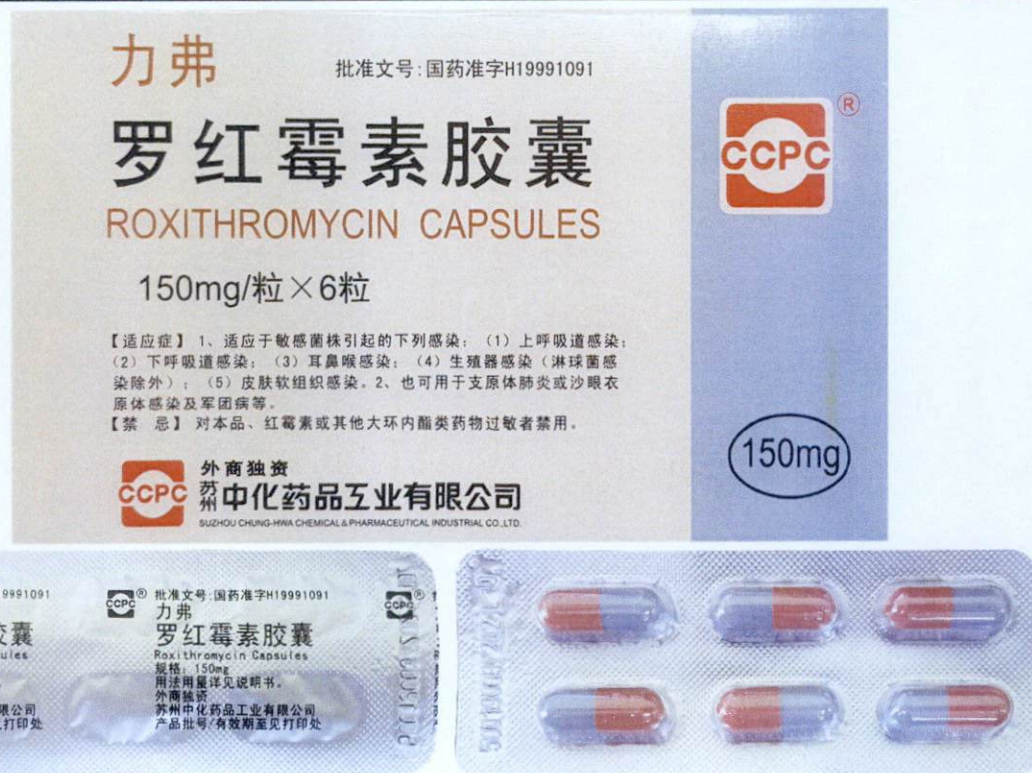
CCPC® Roxithromycin Capsules 150 mg by: Suzhou Chung-Hwa Chemical & Pharmaceutical Industrial Co., Ltd.