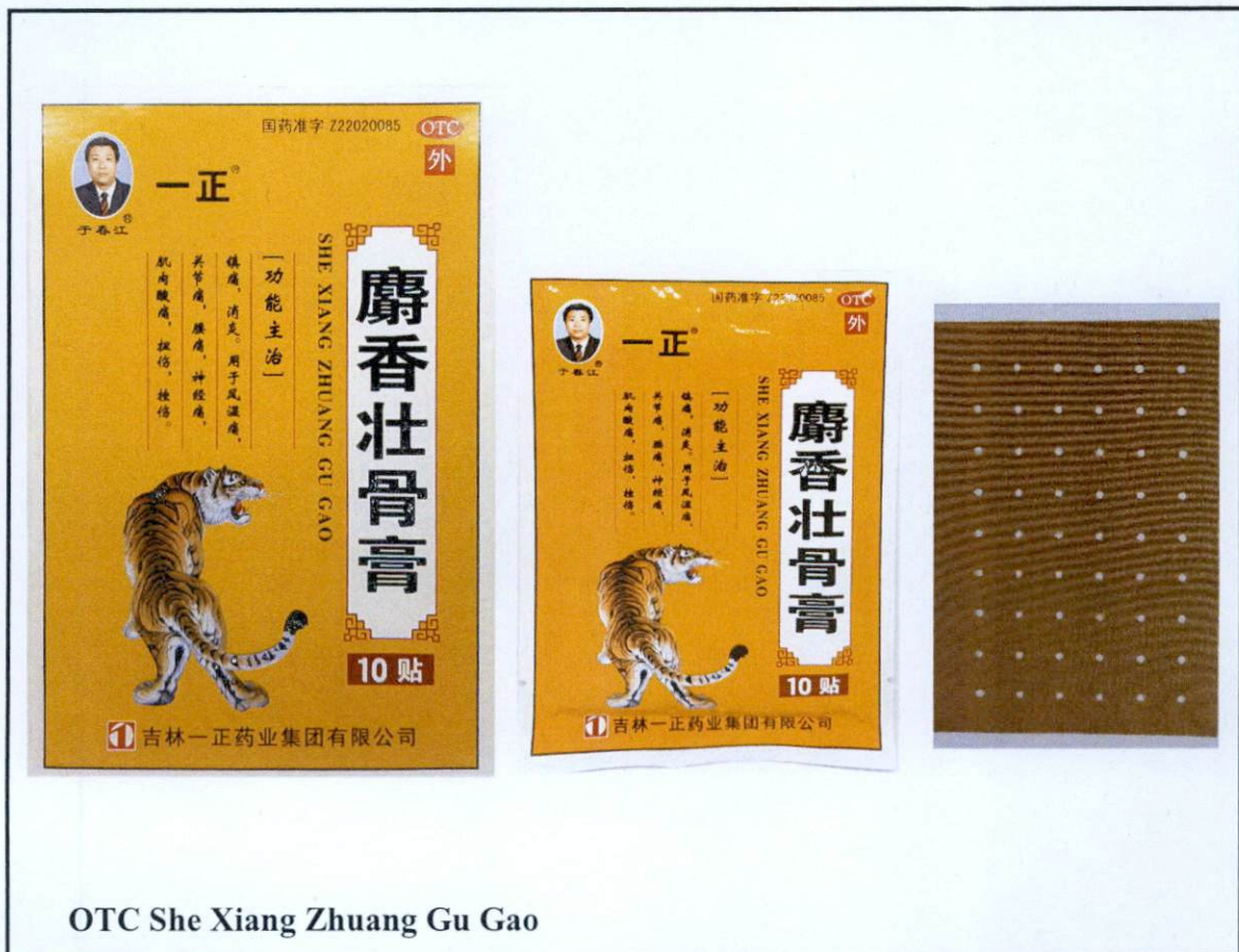
OTC She Xiang Zhuang Gu Gao

Pinapayuhan ng Food and Drug Administration (FDA) ang publiko laban sa pagbili at paggamit ng mga sumusunod na hindi rehistradong gamot: