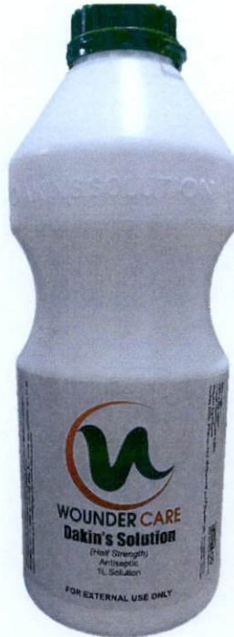
Wounder Care Dakin's Solution (Quarter Strength) 1L Solution Manufactured by: LBCT.CO