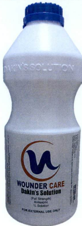
Wounder Care Dakin's Solution (Quarter Strength) 1L Solution Manufactured by: LBCT.CO