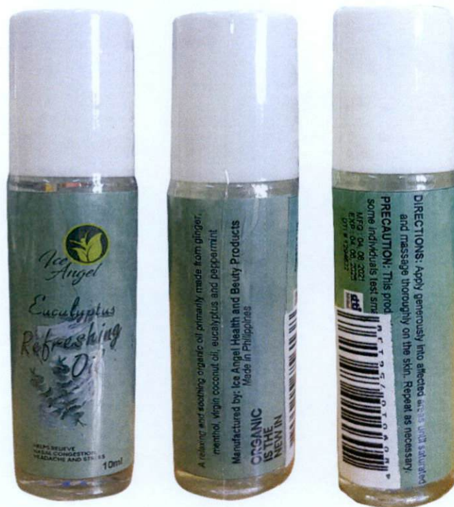
Ice Angel Eucalyptus Refreshing Oil 10 mL Manufactured by: Ice Angel Health and Beauty Products