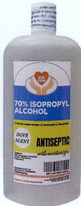
Alco Clean 70% Isopropyl Alcohol with Moisturizer Dove scent 500 mL Manufactured by: Alcoclean Cosmetics Manufacturing – Marilao, Bulacan