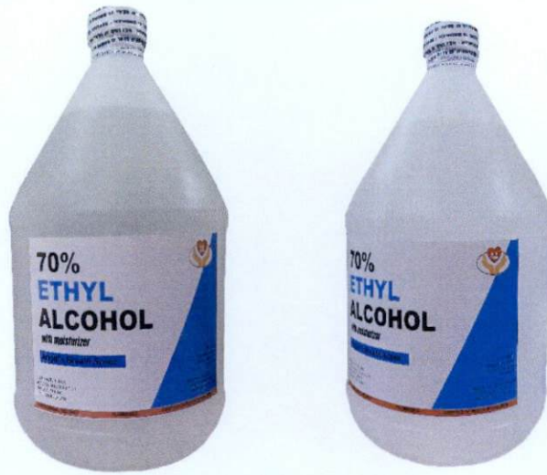
Alco Clean 70% Ethyl Alcohol with Moisturizer Angel's Breath Scent Manufactured by: Alcoclean Cosmetics Manufacturing – Marilao, Bulacan