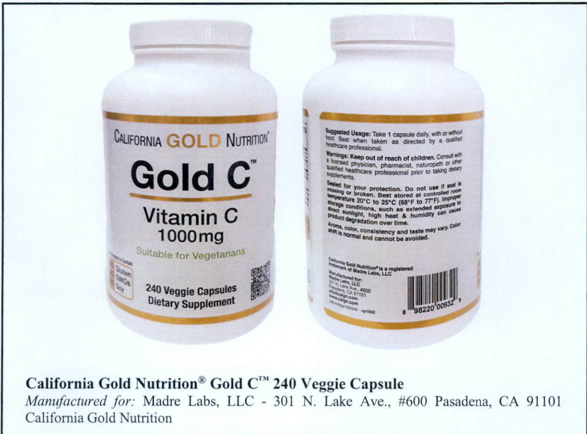
California Gold Nutrition® Gold C™ 240 Veggie Capsule Manufactured for: Madre Labs, LLC - 301 N. Lake Ave., #600 Pasadena, CA 91101 California Gold Nutrition