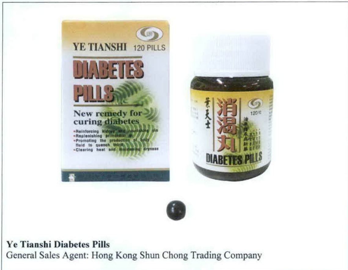
Larawan 1. Hindi rehistradong produkto

Pinapayuhan ng Food and Drug Administration (FDA) ang publiko laban sa pagbili at paggamit ng hindi rehistradong gamot na Ye Tianshi Diabetes Pills: