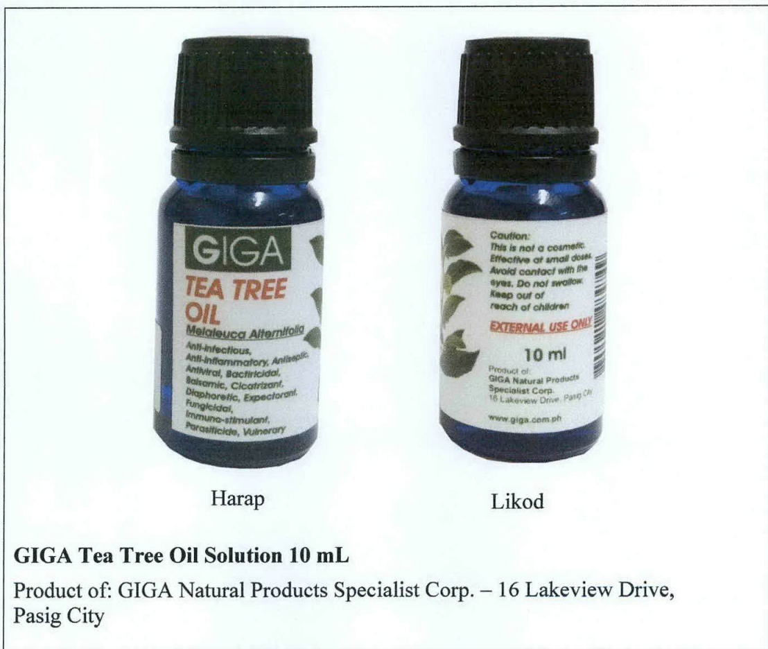
Larawan 1. Hindi rehistradong produkto

Pinapayuhan ng Food and Drug Administration (FDA) ang publiko laban sa pagbili at paggamit ng hindi rehistradong gamot na GIGA Tea Tree Oil Solution: