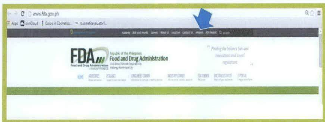
Larawan 2. e-Report Section of the FDA Website

Maaring ipadala sa FDA gamit ang e-Report tulad ng ipinapakita sa mga larawan: