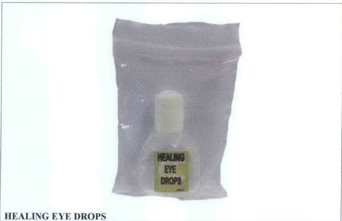
HEALING EYE DROPS

Pinapayuhan ng Food and Drug Administration (FDA) ang publiko laban sa pagbili at paggamit ng mga hindi rehistradong gamot na: