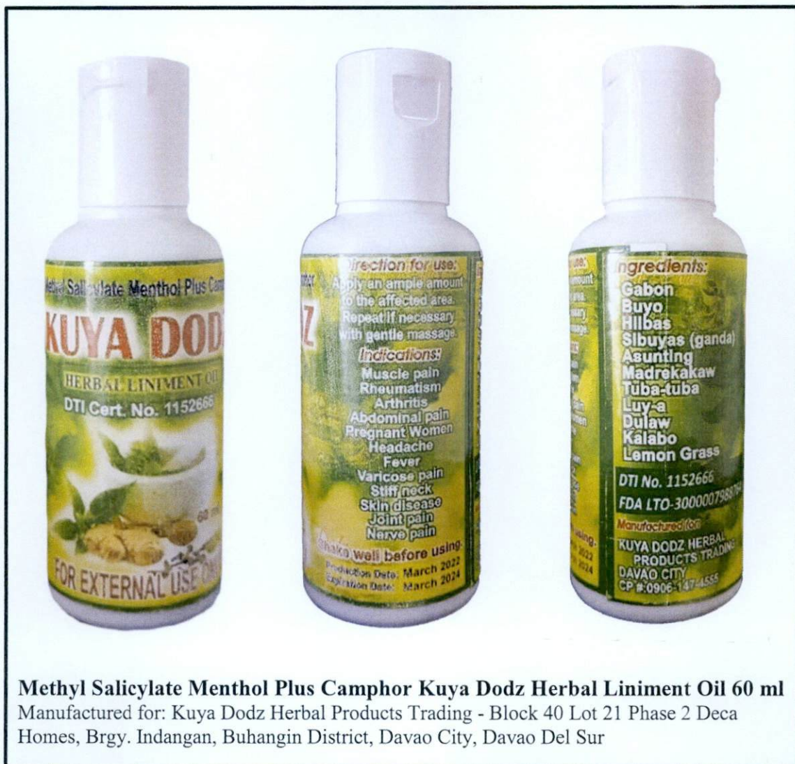
Larawan 1. Hindi rehistradong gamot

Pinapayuhan ng Food and Drug Administration (FDA) ang publiko laban sa pagbili at paggamit ng hindi rehistradong gamot na: