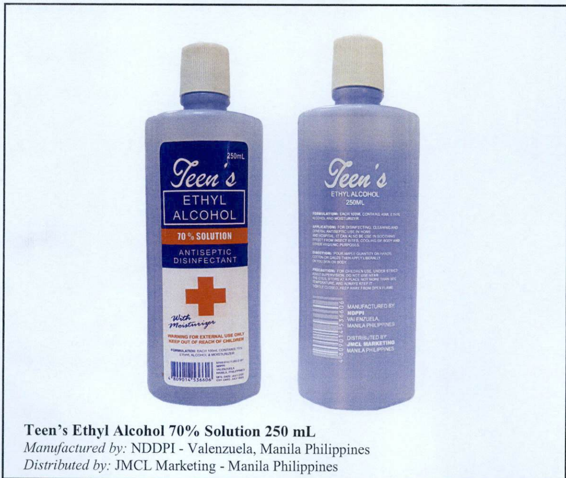
Larawan 1. Hindi rehistradong gamot

Pinapayuhan ng Food and Drug Administration (FDA) ang publiko laban sa pagbili at paggamit ng mga sumusunod na hindi rehistradong gamot: