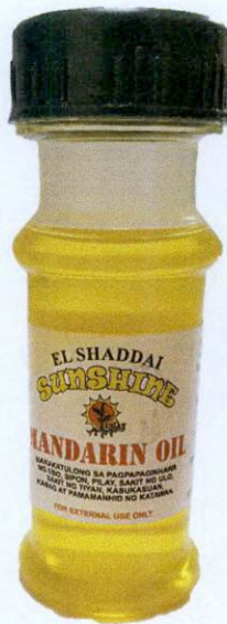
El Shaddai Sunshine Ugat Mandarin Oil