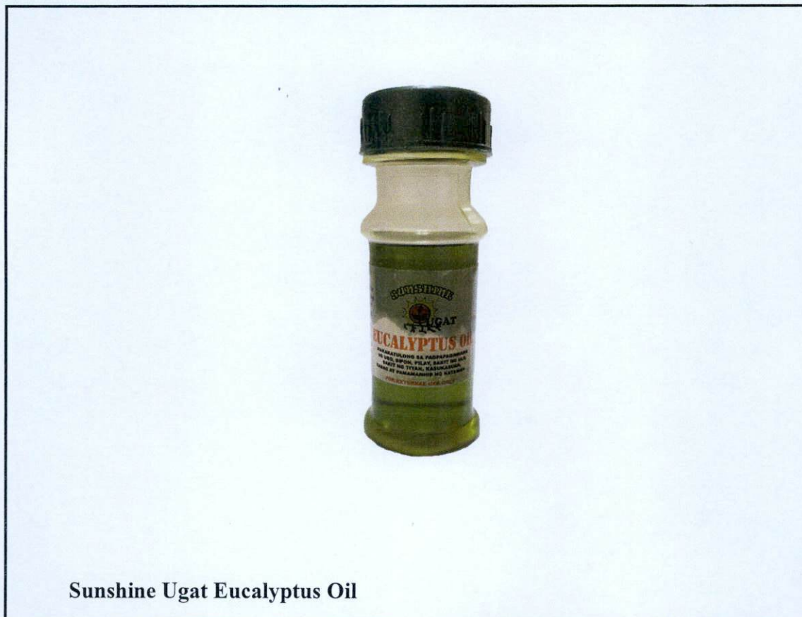
Sunshine Ugat Eucalyptus Oil

Pinapayuhan ng Food and Drug Administration (FDA) ang publiko laban sa pagbili at paggamit ng mga sumusunod na hindi rehistradong gamot: