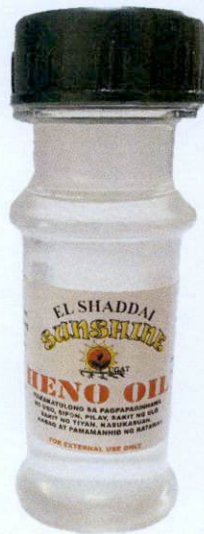
El Shaddai Sunshine Ugat Heno Oil