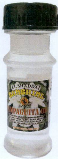
El Shaddai Sunshine Ugat Sampaguita Oil