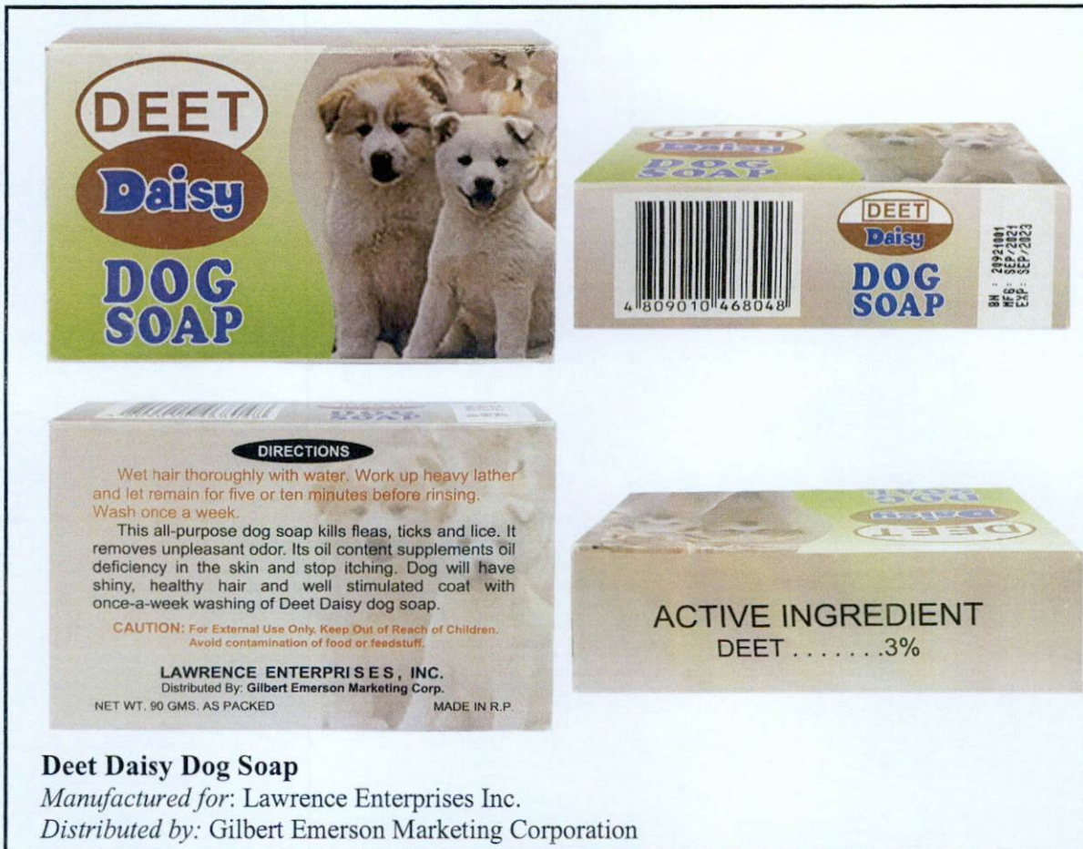
Larawan 2. Hindi rehistradong betertiaryong gamot

Napatunayan sa pamamagitan ng isinagawang Post-Marketing Surveillance (PMS) ng FDA na ang mga nasabing gamot ay hindi dumaaan sa proseso ng rehistrasyon ng Ahensya at hindi nabigyan ng kaukulang awtorisasyon tulad ng Certificate of Product Registration (CPR). Dahil dito, hindi masisiguro ng Ahensya ang kalidad, kaligtasan at bisa nito. Samakatuwid, ang paggamit ng nasabing mga iligal na produkto ay maaaring magdulot ng panganib sa kalusugan.