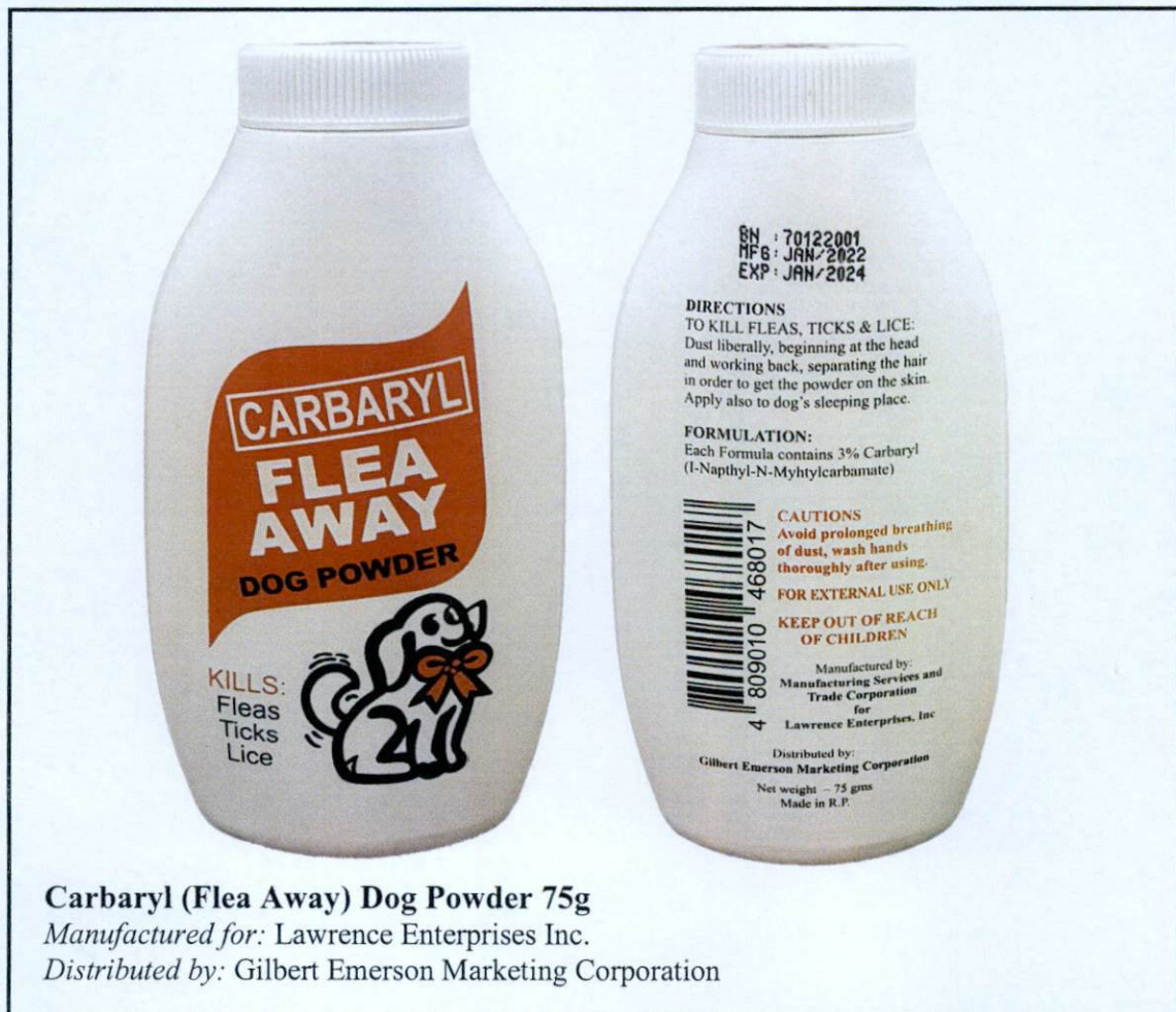
Larawan 1. Hindi rehistradong beterinaryong gamot

Pinapayuhan ng Food and Drug Administration (FDA) ang publiko laban sa pagbili at paggamit ng mga sumusunod na hindi rehistradong beterinaryong gamot: