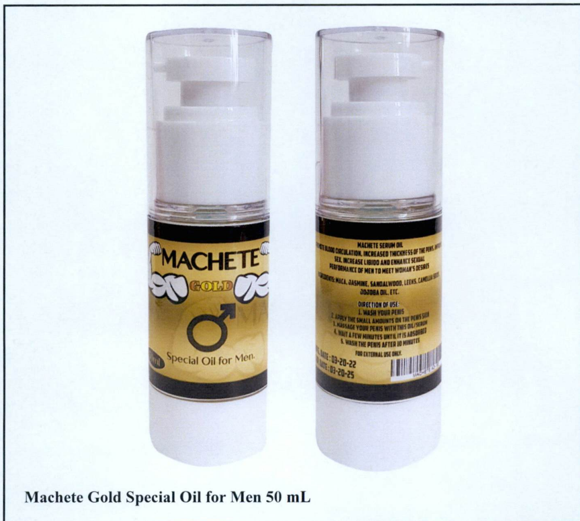
Machete Gold Special Oil for Men 50 mL

Pinapayuhan ng Food and Drug Administration (FDA) ang publiko laban sa pagbili at paggamit ng mga sumusunod na hindi rehistradong gamot: