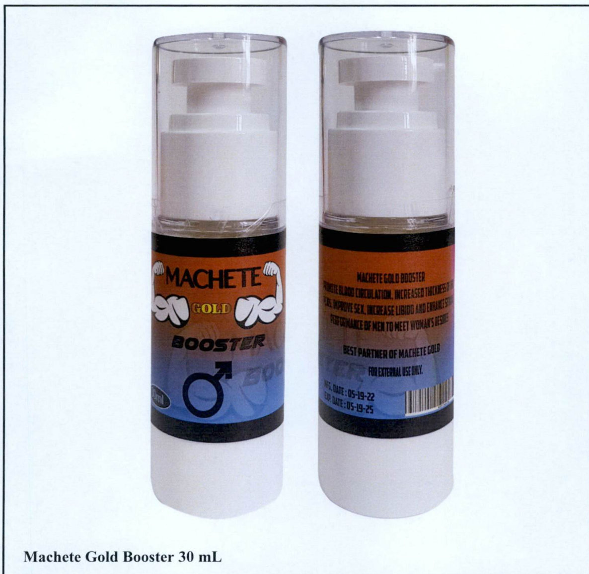
Machete Gold Booster 30 mL