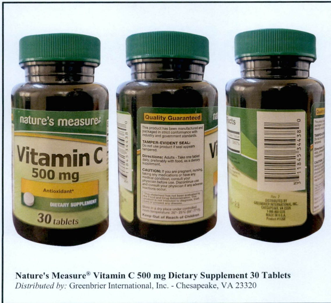
Nature's Measure® Vitamin C 500 mg Dietary Supplement 30 Tablets Distributed by: Greenbrier International, Inc. - Chesapeake, VA 23320

Pinapayuhan ng Food and Drug Administration (FDA) ang publiko laban sa pagbili at paggamit ng hindi rehistradong gamot na: