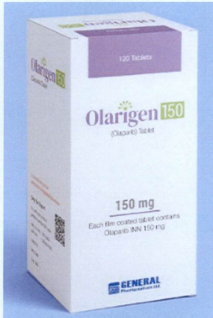
General Pharmaceuticals Ltd. Olarigen 150 (Olaparib) Tablet