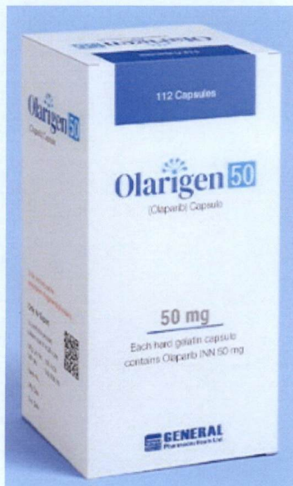
General Pharmaceuticals Ltd. Olarigen 50 (Olaparib) Capsule

Pinapayuhan ng Food and Drug Administration (FDA) ang publiko laban sa pagbili at paggamit ng mga sumusunod na hindi rehistradong gamot: