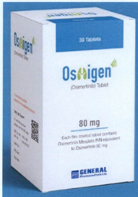
General Pharmaceuticals Ltd. Osmigen 80 (Osimertinib) Tablet