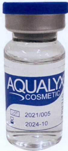
Aqualyx ® Cosmetic Sterile