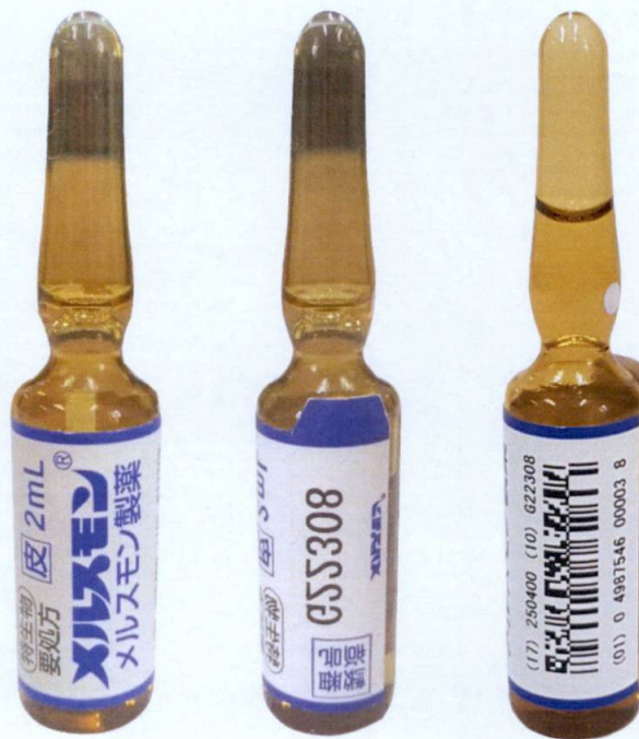
[Label in Foreign Language] 2 mL