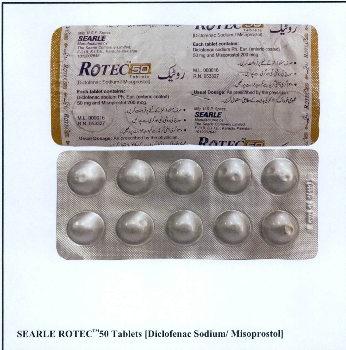
SEARLE ROTEC™50 Tablets [Diclofenac Sodium/ Misoprostol]

Pinapayuhan ng Food and Drug Administration (FDA) ang publiko laban sa pagbili at paggamit ng hindi rehistradong gamot na: