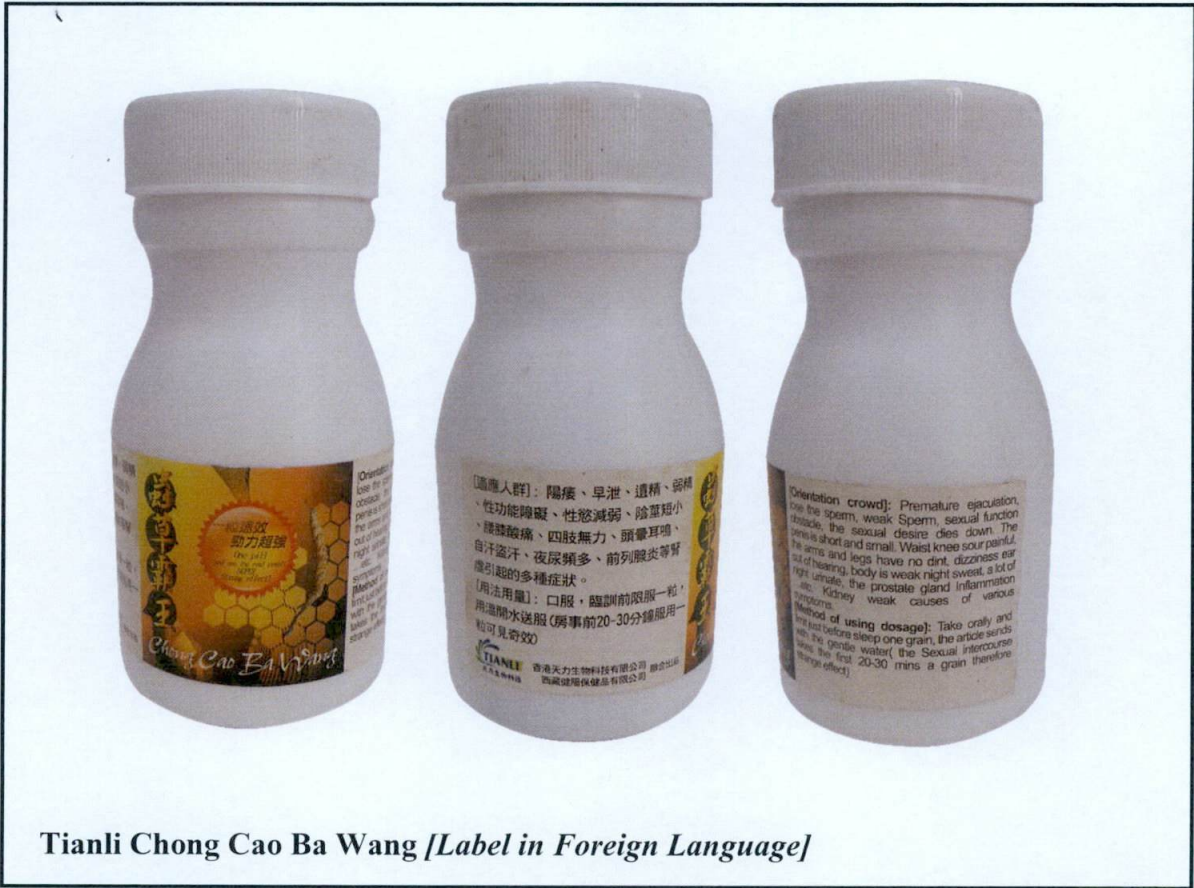
Tianli Chong Cao Ba Wang [Label in Foreign Language]