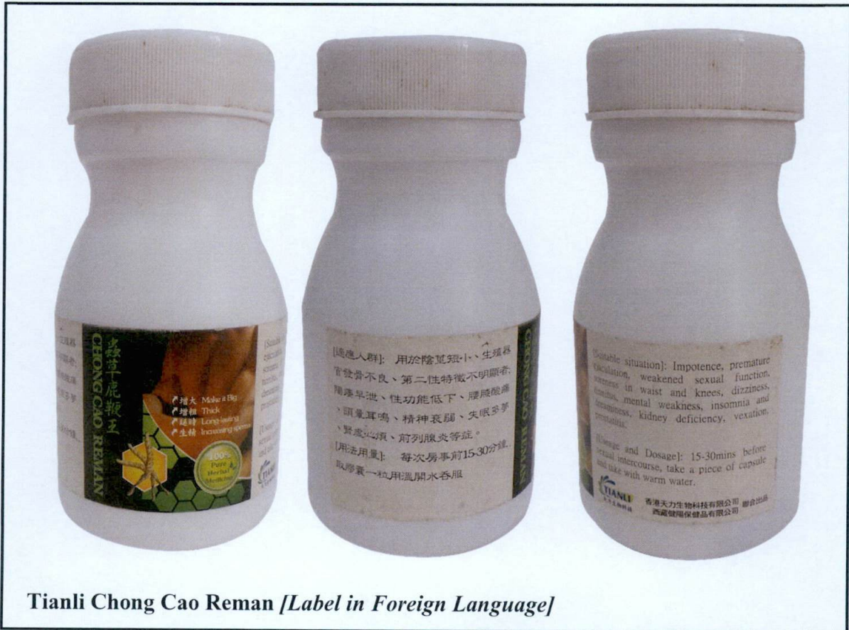
Tianli Chong Cao Reman [Label in Foreign Language]