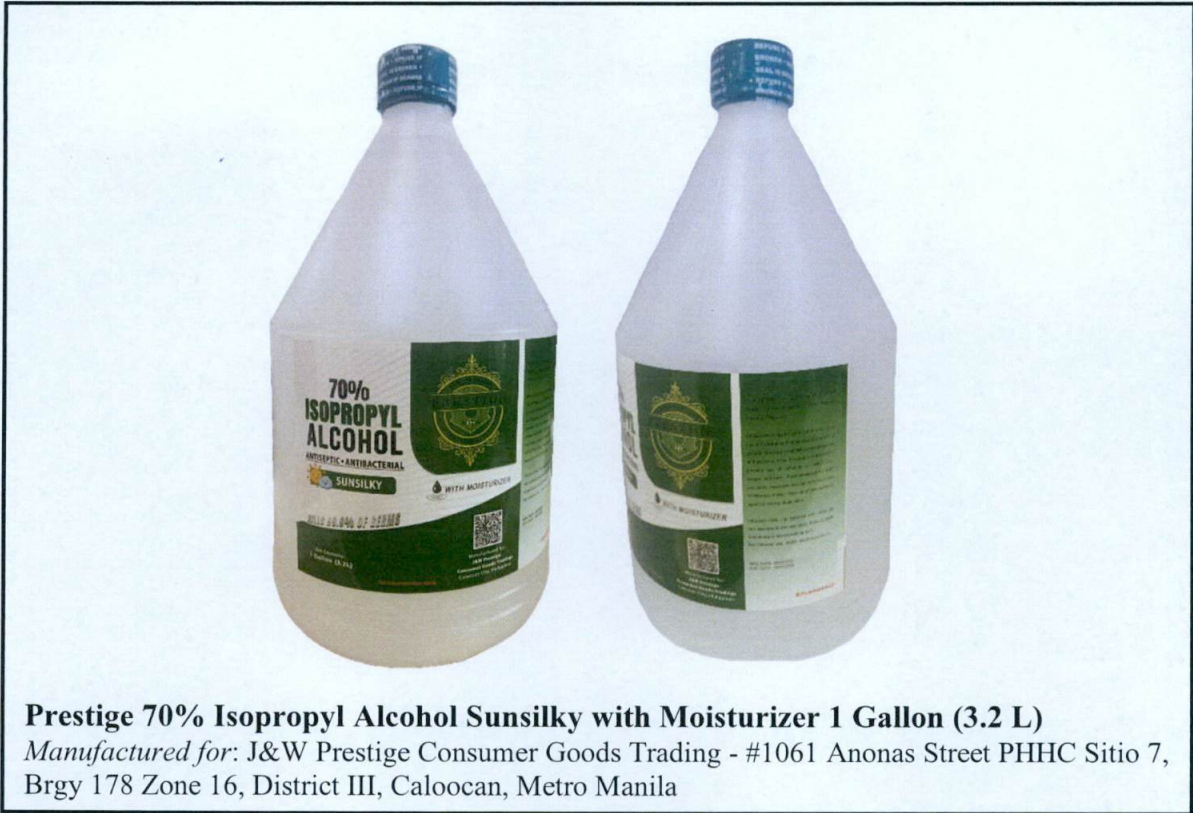
Prestige 70% Isopropyl Alcohol Sunsilky with Moisturizer 1 Gallon (3.2 L) Manufactured for: J&W Prestige Consumer Goods Trading - #1061 Anonas Street PHHC Sitio 7, Brgy 178 Zone 16, District III, Caloocan, Metro Manila