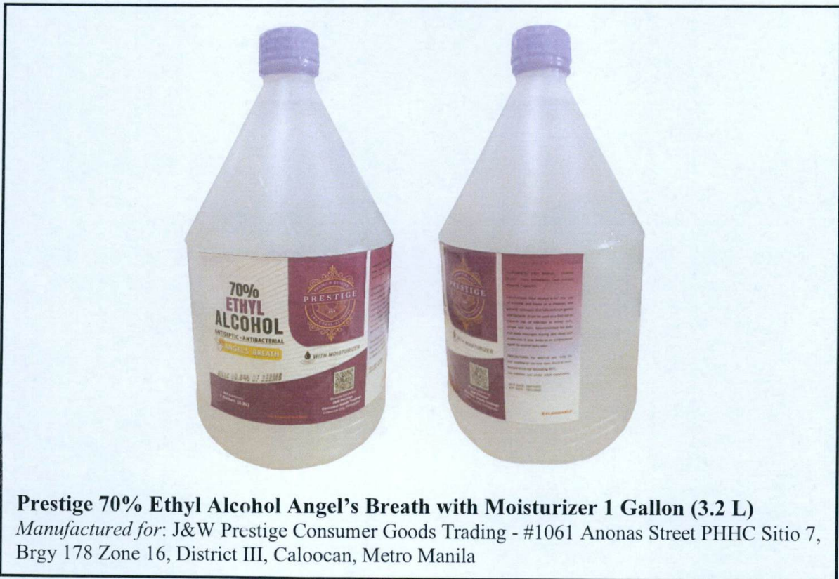
Prestige 70% Ethyl Alcohol Angel's Breath with Moisturizer 1 Gallon (3.2 L) Manufactured for: J&W Prestige Consumer Goods Trading - #1061 Anonas Street PHHC Sitio 7, Brgy 178 Zone 16, District III, Caloocan, Metro Manila