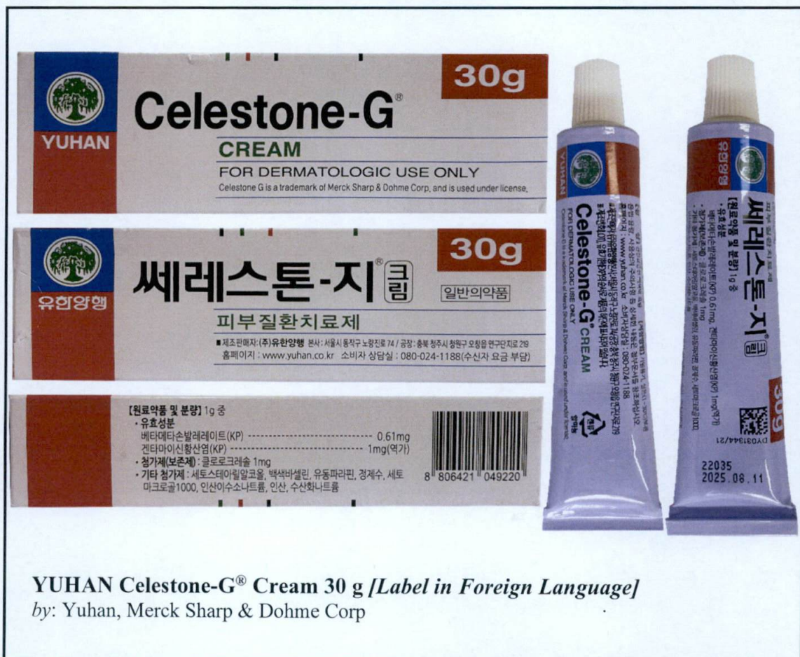
YUHAN Celestone-G® Cream 30 g [Label in Foreign Language] by: Yuhan, Merck Sharp & Dohme Corp

Pinapayuhan ng Food and Drug Administration (FDA) ang publiko laban sa pagbili at paggamit ng mga sumusunod na hindi rehistradong gamot: