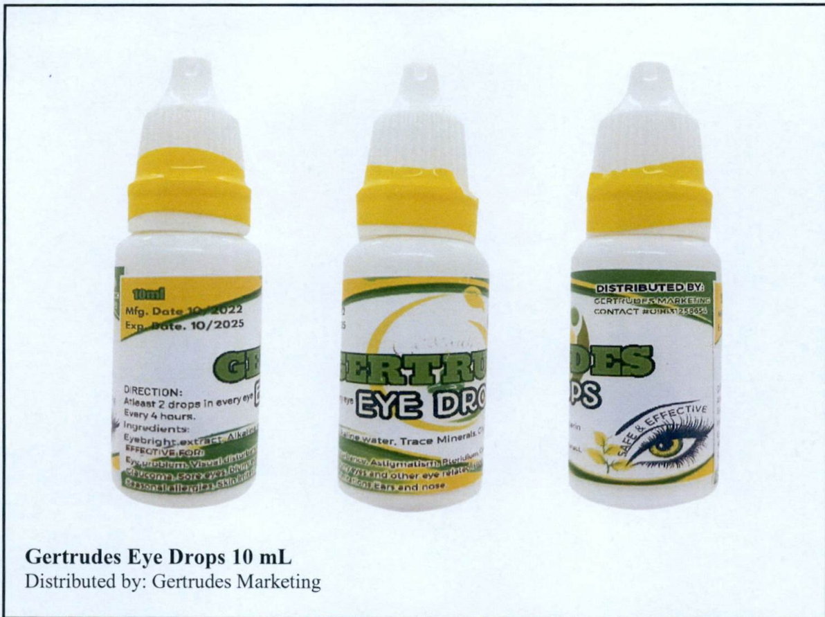
Gertrudes Eye Drops 10 mL Distributed by: Gertrudes Marketing