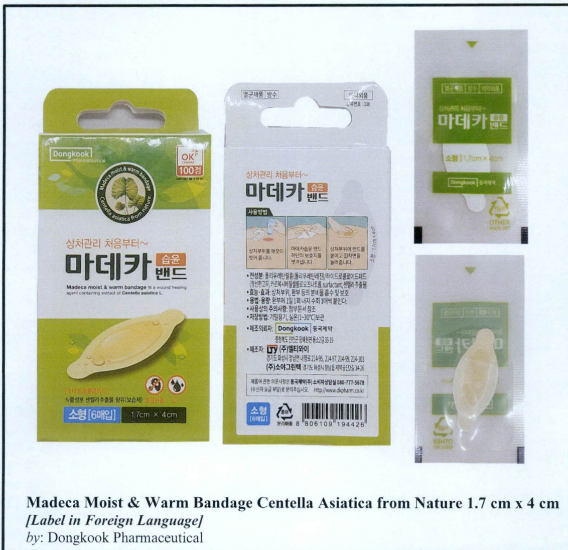
Larawan 1. Hindi rehistradong gamot

Pinapayuhan ng Food and Drug Administration (FDA) ang publiko laban sa pagbili at paggamit ng hindi rehistradong gamot na: