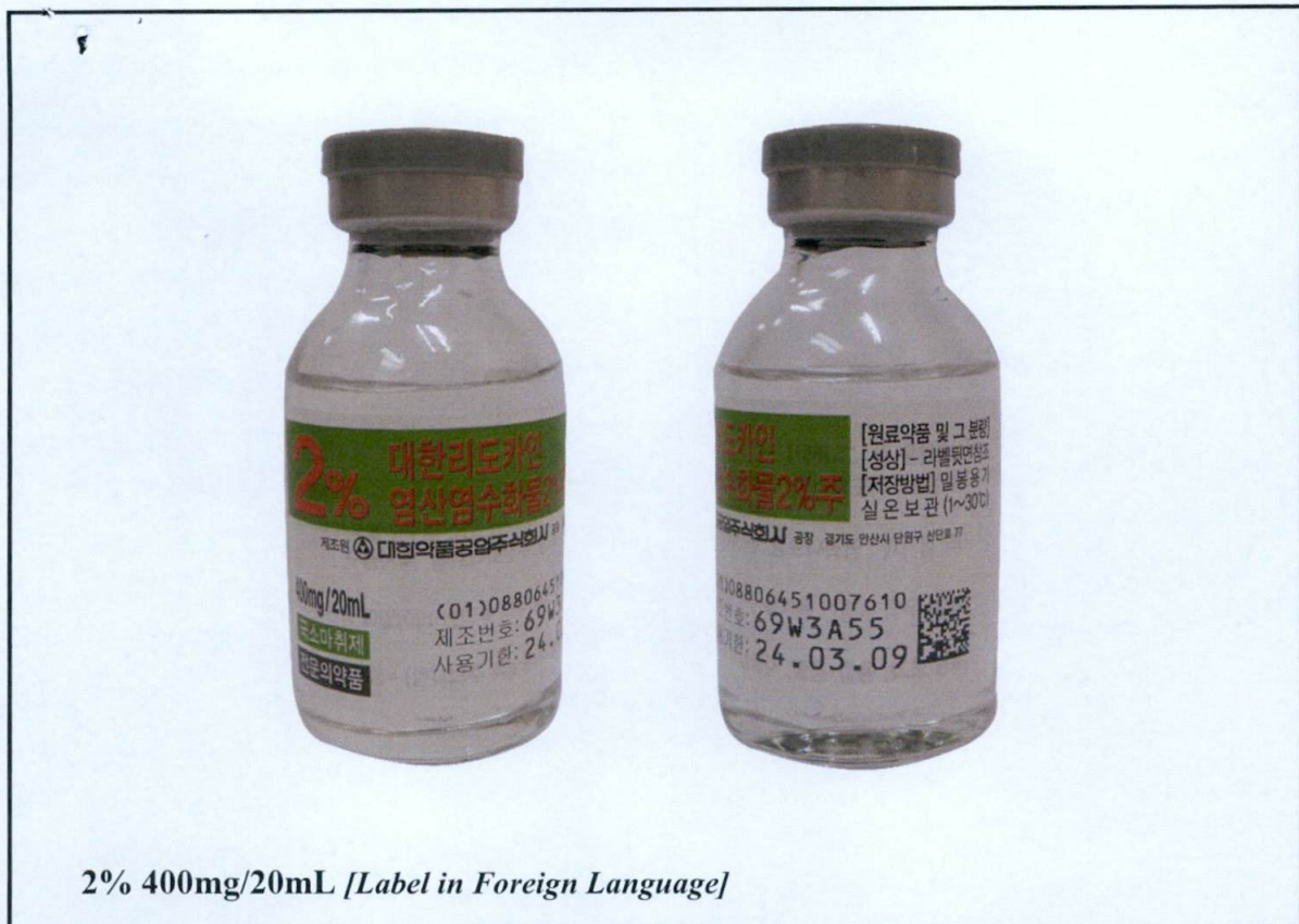
2% 400mg/20mL [Label in Foreign Language]