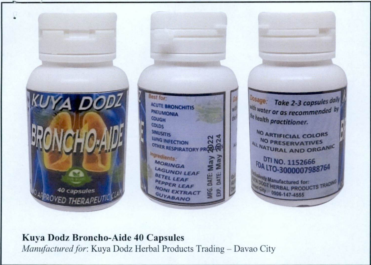
Kuya Dodz Broncho-Aide 40 Capsules Manufactured for: Kuya Dodz Herbal Products Trading – Davao City