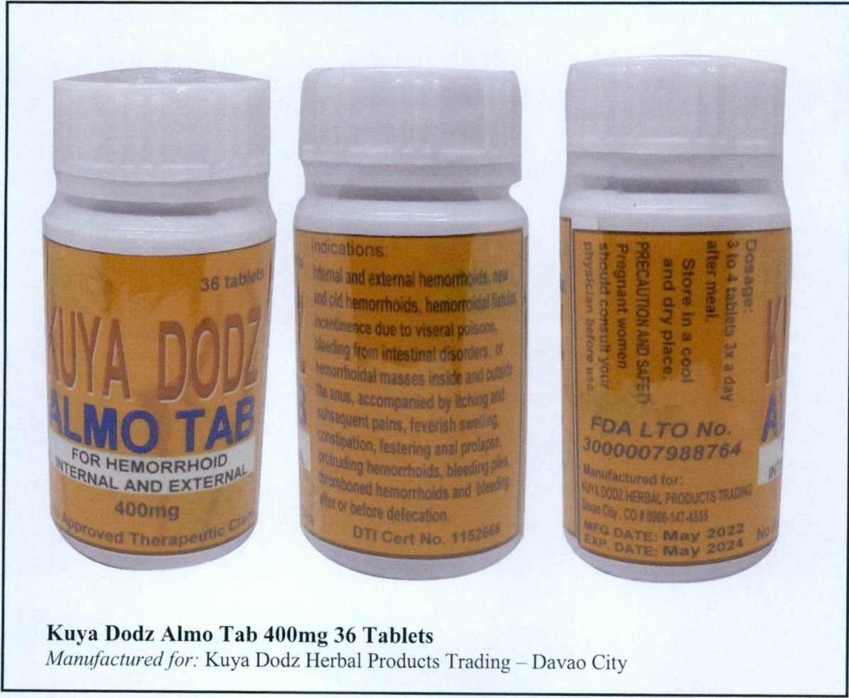
Kuya Dodz Almo Tab 400mg 36 Tablets Manufactured for: Kuya Dodz Herbal Products Trading – Davao City