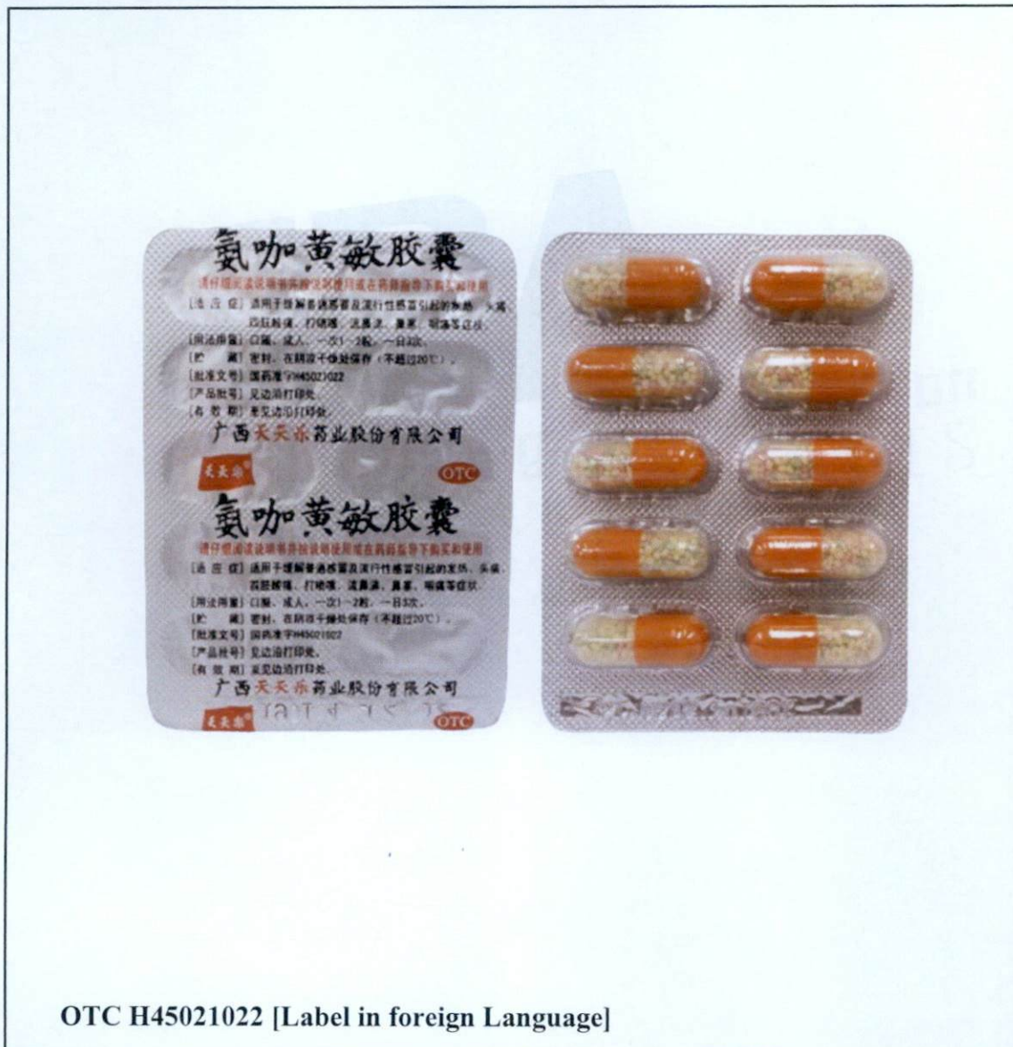
OTC H45021022 [Label in foreign Language]

Pinapayuhan ng Food and Drug Administration (FDA) ang publiko laban sa pagbili at paggamit ng hindi rehistradong gamot na: