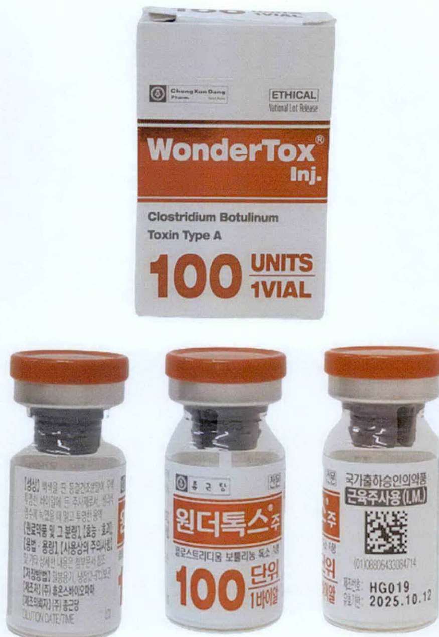
Ethical WonderTox® Inj Clostridium Botulinum Toxin Type A 100 units x 1 vial Manufactured by: Huons Biopharm Co., Ltd. – 50 Biovalley 2-ro, Jecheon-si, Chungcheongbuk-do (as translated)