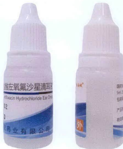
Levofloxacin Hydrochloride Ear Drops 5 mL