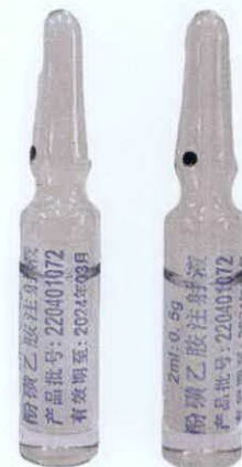
Fenhuangyi 'An Zhusheyeye 2mL: 0.5g Ampoule by: Xinxiang Changle Pharmaceutical CO., LTD.