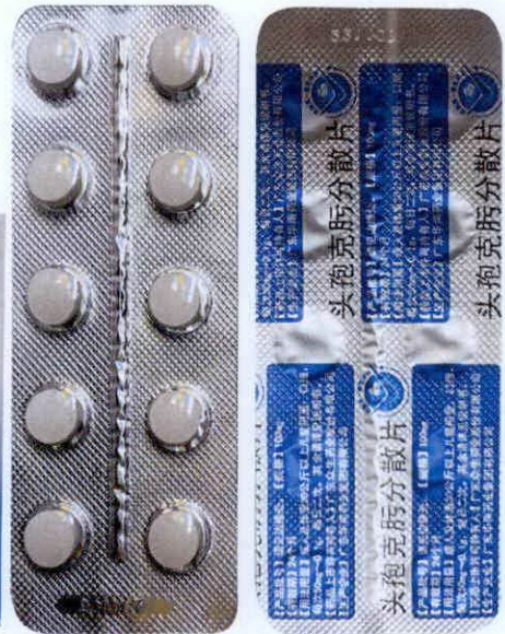
Pharm® Tuobaokewo Fens pian – Cefixime Dispersible Tablets [as reflected in package insert]